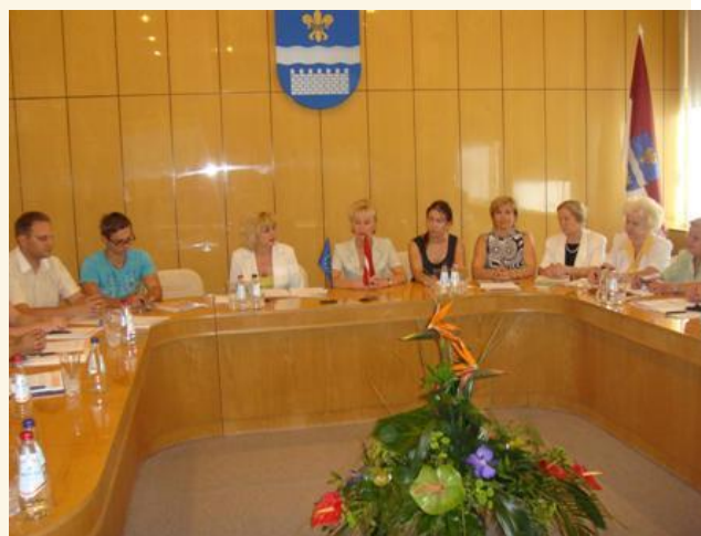
Foto: apaļā galda diskusija Daugavpils pilsētā.