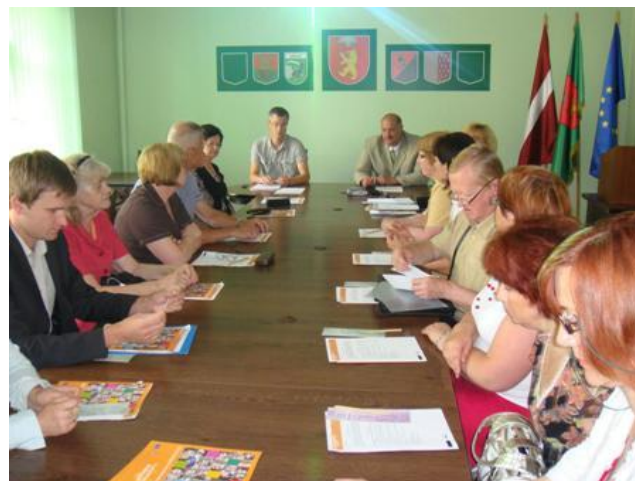
Foto: apaļā galda diskusija Valkas pilsētā.

Valkas novada diskusijas rezultātā izkristalizējās, ka nepieciešams izveidot vietēja mēroga labo ideju koordinācijas centru , kurš veicinātu NVO attīstību, koordinējot labo ideju un prakses apmaiņu starp NVO, nodrošinot informāciju, palīdzot vietējam NVO iegūt līdzekļus nepieciešamā aprīkojuma iegādei, piemēram, ratiņkrēslus, speciāli aprīkotus autobusus invalīdu pārvadāšanai u.c. Vienlaikus jāveido ciešāku un koordinētāku sadarbību starp dažādām NVO un pašvaldību iestādēm.