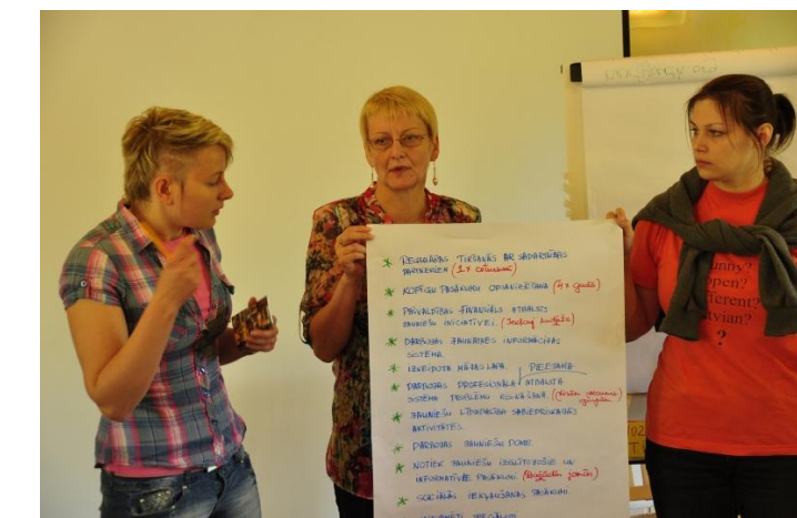
Foto: darbs grupās

“Jaunatnes politikas ABC” izstrādāts projekta “Jaunieši stratēģiskai jaunatnes politikas attīstībai pašvaldībās” ietvaros, kas tika īstenots ar Eiropas Komisijas, Ziemeļu Ministru padomes biroja Latvijā un Sorosa Fonds Latvija finansiālu atbalstu. Šī publikācija atspoguļo vienīgi autora uzskatus, un projekta finansētājiem nevar uzlikt atbildību par tajā ietvertās informācijas jebkuru iespējamo izlietojumu.